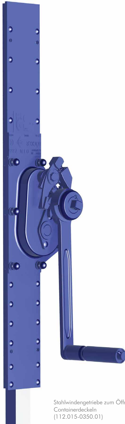
Stahlwindengetriebe zum Öffnen von Containerdeckeln (112.015-0350.01)